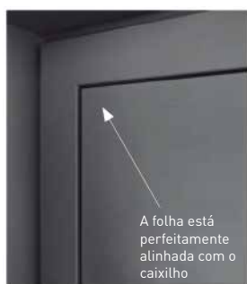
Folha coplanar da coleção

Nada interrompe a continuidade das linhas: superfície plana, formas geométricas perfeitamente integradas em altura e largura, integração subtil dos acessórios... A gama SURFACE eleva os limites da pureza de linhas e da elegância.