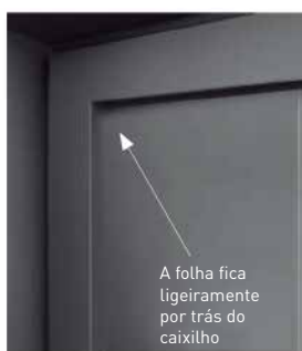
Folha com revestimento tradicional