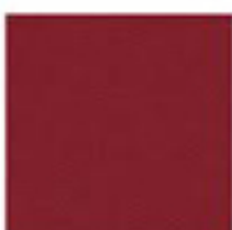
ROUGE (3004 T)