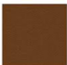
MARRON (8011 T)