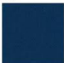
BLEU FONCÉ (5003 T)