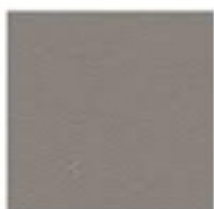
GRÈGE (9007 T)