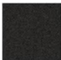
NOIR SABLÉ 2100