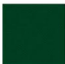
VERT FONCÉ (6005 T)