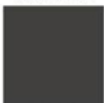
TAUPE (7022 S)