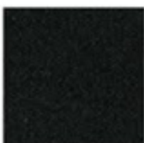
NOIR TEXTURÉ (9005 T)