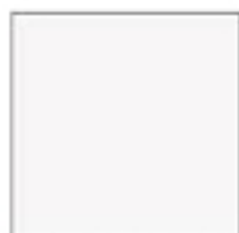
BLANC SATINÉ (9016 S)